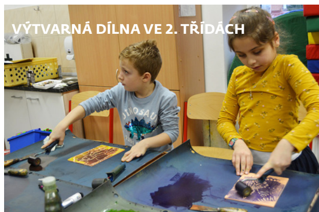
VÝTVARNÁ DÍLNA VE 2. TŘÍDÁCH