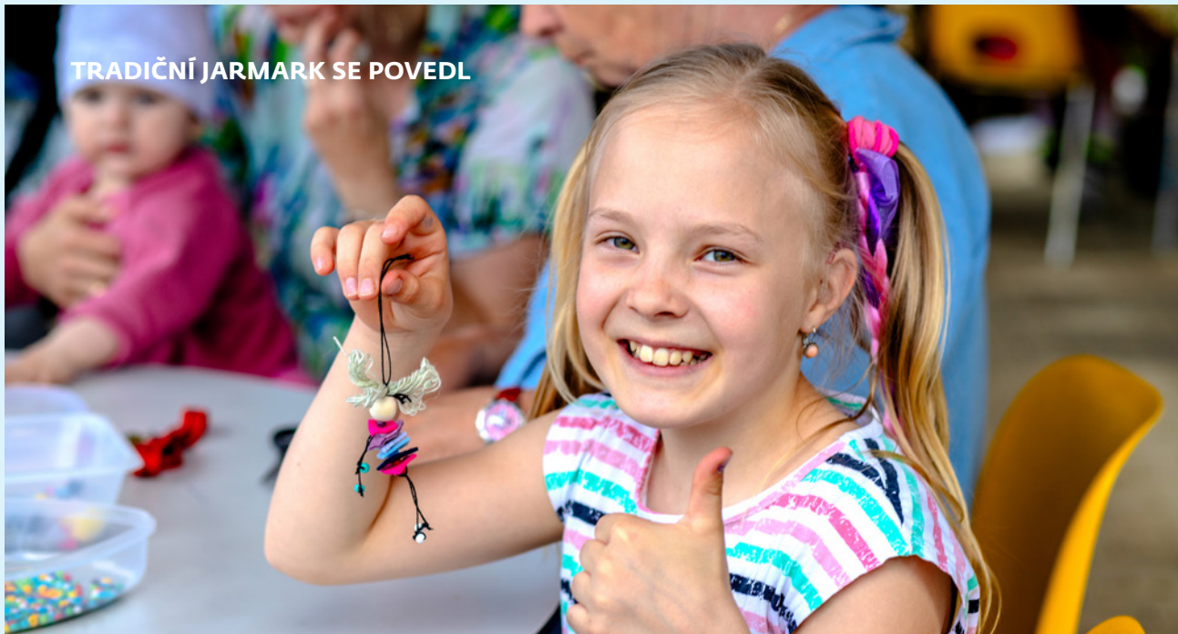
TRADIČNÍ JARMARK SE POVEDL

Dne 15. května se na ZŠ Kaplického konal tradiční jarmark, který opět přilákal mnoho návštěvníků. Celá akce proběhla ve znamení radosti, tvořivosti a skvělého počasí. Každá třída měla svůj stánek, kde žáci prodávali vlastnoručně zhotovené výrobky. Nabídka byla pestrá a zahrnovala různé řemeslné výrobky, dekorace, a také originální dárky.