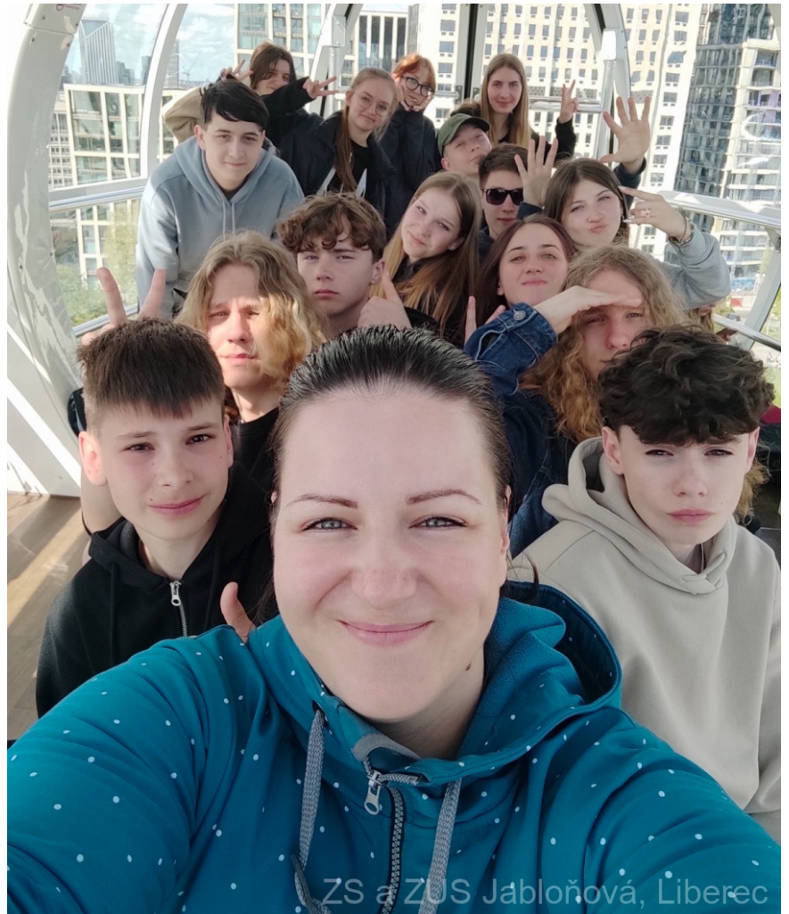
ZŠ a ZUŠ Jabloňová, Liberec