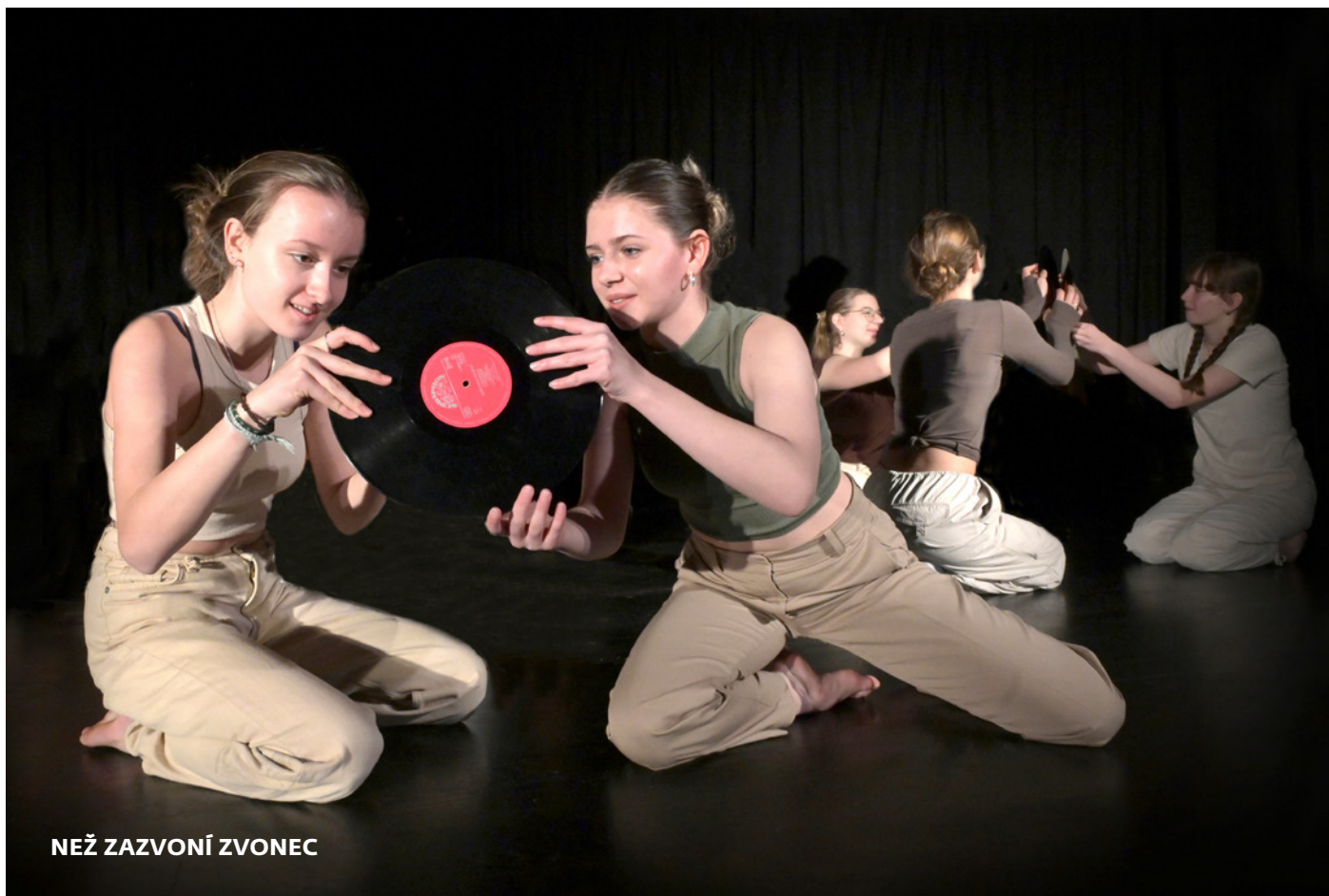
NEŽ ZAZVONÍ ZVONEC

V Naivním divadle proběhla tradiční přehlídka mladého divadla „Než zazvoní zvonec“. Představily se zde především soubory Dramacentra Bezejména. Nejmladší soubor BezeStrachu zahrál pohádku „Král snů“, soubor BezUrážky si vyrovnal účty s dospělými v inscenaci „Chceme vám něco vybarvit!“ Soubor BezeSporu se ponořil do dystopického světa inscenací „O světě a Stavu“, soubor BezOhledu představil dvě inscenace – „Svědectví o životě v KLDK“ a oprášil, díky pozvání Činoherního klubu Praha, novou inscenaci „Miserere mei“ zase chystá na celostátní přehlídce Mladá scéna a Wolkrův Prostějov. Jako hosté vystoupili turnovští Tutu Bazo s vtipnou satirou „Street poezie“ a Jiskrův zážeh s loutkovou politickou satirou „Mrazíkova razié“. V červenci se přehlídka přesune do Rokytnice nad Jizerou. Akci podpořil Liberecký kraj a Fond kultury a cestovního ruchu statutárního města Liberec.