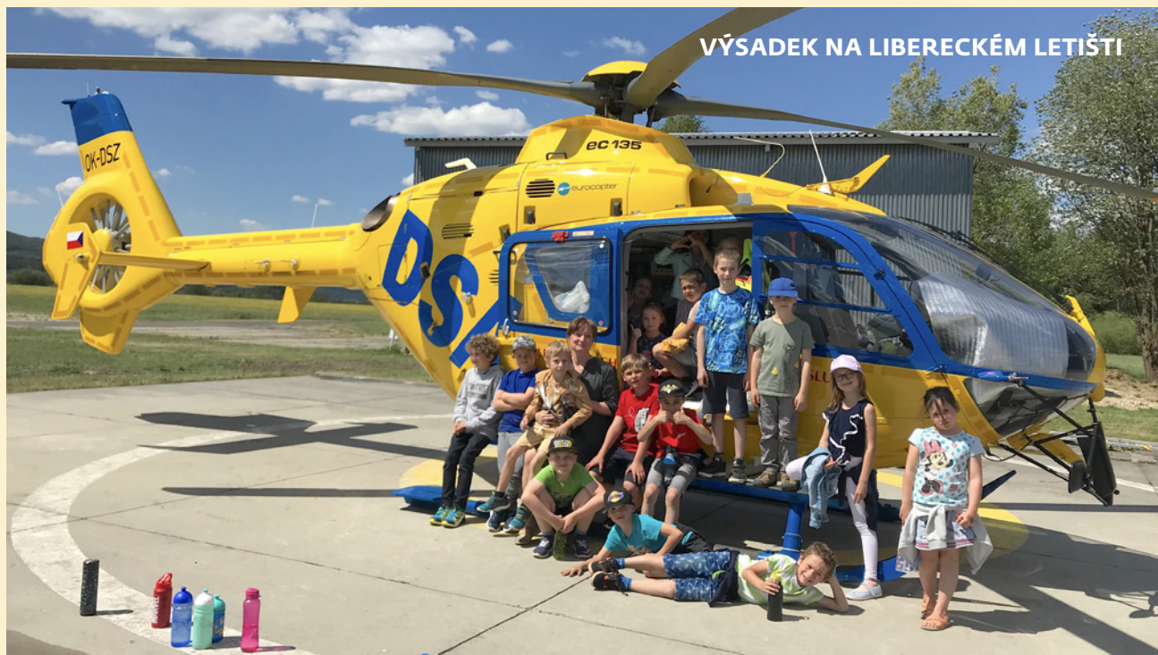
VÝSADEK NA LIBERECKÉM LETIŠTI

Ve středu 15. května provedla dvě oddělení školní družiny výsadek na libereckém letišti. První oddělení školní družiny navštívilo hangáry libereckého aeroklubu.