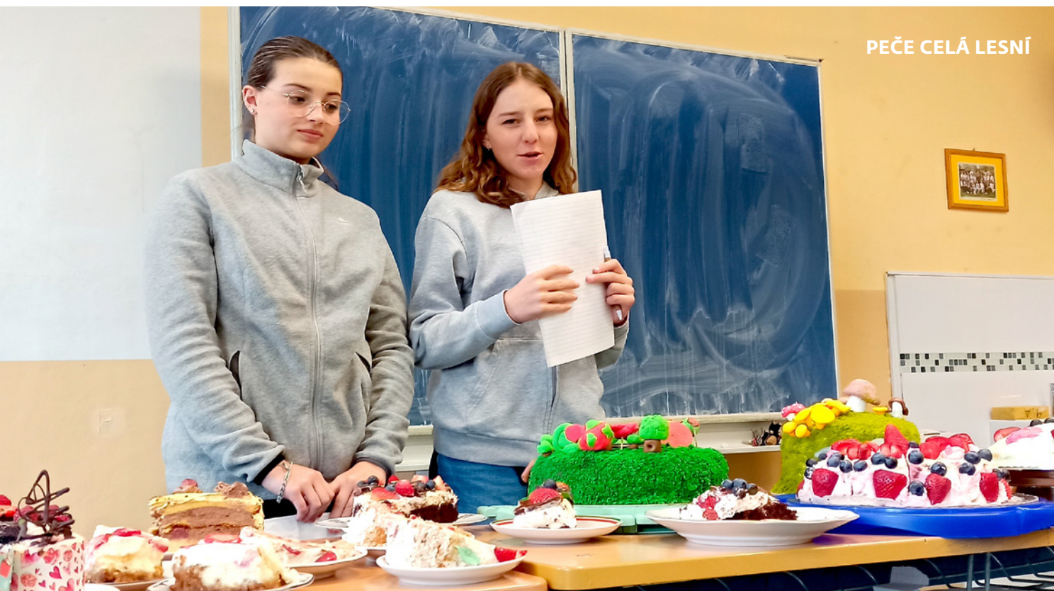
PEČE CELÁ LESNÍ

Nejnovější akce žakovského parlamentu na naší škole byla inspirována populárním pořadem České televize Peče celá země.